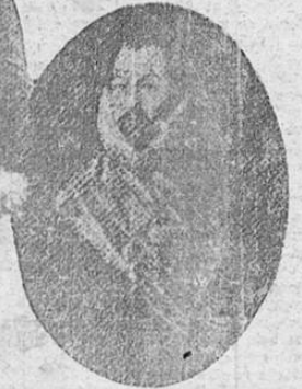
Según los españoles, Francisco Drake era un engendro del infierno que hundió barcos y saqueó e incendió ciudades, sembrando el terror en todas partes. En sus arriesgadas proezas logró acumular una enorme fortuna; pero más osado que él, y quizás más astuto, era Oscar Merrill Hartzell, el gran estafador norteamericano.