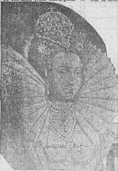
La reina Isabel, izquierda, una de las primeras en admirar la intrepidez de Francisco Drake, el célebre corsario y marino inglés. Por ella, el "azote de las posesiones españolas" emprendió sus correrías afortunadas que contribuyeron a cimentar el envidiable poderío marítimo de su patria.

efectuó una conferencia económica en la cual participaron unas 66 naciones? Para discutir acaloradamente el asunto relacionado con la herencia de Francisco Dra-