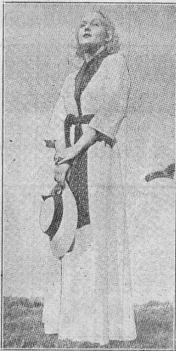
de nuestros mejores conjuntos son grises en su efecto, lo cual es algo nuevo, hay que admitirlo. El chifón gris es una de las últimas palabras

Desde hace muchos años no se han usado tantos matices de violeta como en el momento actual. El color violeta se usa para los sombreros y sobre éstos — la toca y el turbante adornados con flores están fuéramente en boga — y se usan matices de este color para adornar vestidos y las flores en sí para lucirlas como bouquet en la cintura. Sería difícil abusar de las flores. Justamente ahora se usan en gran profusión. Y ya que hablamos de violetas, no debe olvidarse que los llamados matices violinados, en realidad, todos los matices violeta, malva, morados y lilas son muy novedosos, especialmente en los tejidos estampados.