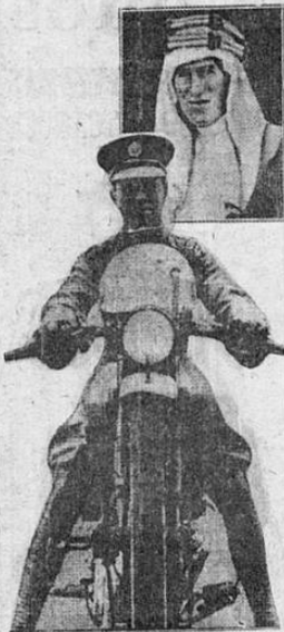
LAWRENCE EL DE ARABIA

Lawrence muere de simple soldado en retiro del Cuerpo de Aviación de Inglaterra; antes había sido soldado del Cuerpo de Tanques. Al terminar su último contrato, en diciembre de 1934, optó por el retiro; y retiro de verdad, tanto que por meses nadie supo dónde estaba. Habían empezado a circular otra vez las versiones fantásticas de que estaba al servicio de la Tercera Internacional, de que iba a levantar a los mahometanos al norte de la India, de que habían vuelto al servicio de los rifeños contra Francia, cuando un buen día de abril recién pasado el "News Chronicle" de Londres publicó este despacho de uno de sus reporteros: "Escondida en la selva de Moreton Heath he encontrado la casa que Lawrence se ha fabricado. En Dorchester, a ocho millas de distancia, nadie me pudo decir donde estaba. La esconde del camino un matorral de rododendros; en realidad se llega a ella a través de una brecha en ese matorral. Di vueltas por un caminito hasta la puerta trasera; golpeé, con un golpeador de bronce que tiene la forma de una hoja. No hubo respuesta. Miré a lo alto del umbral y vi una inscripción en griego que dice: "Nadie tiene que ver usted aquí". En ciertos términos "No me molestes".