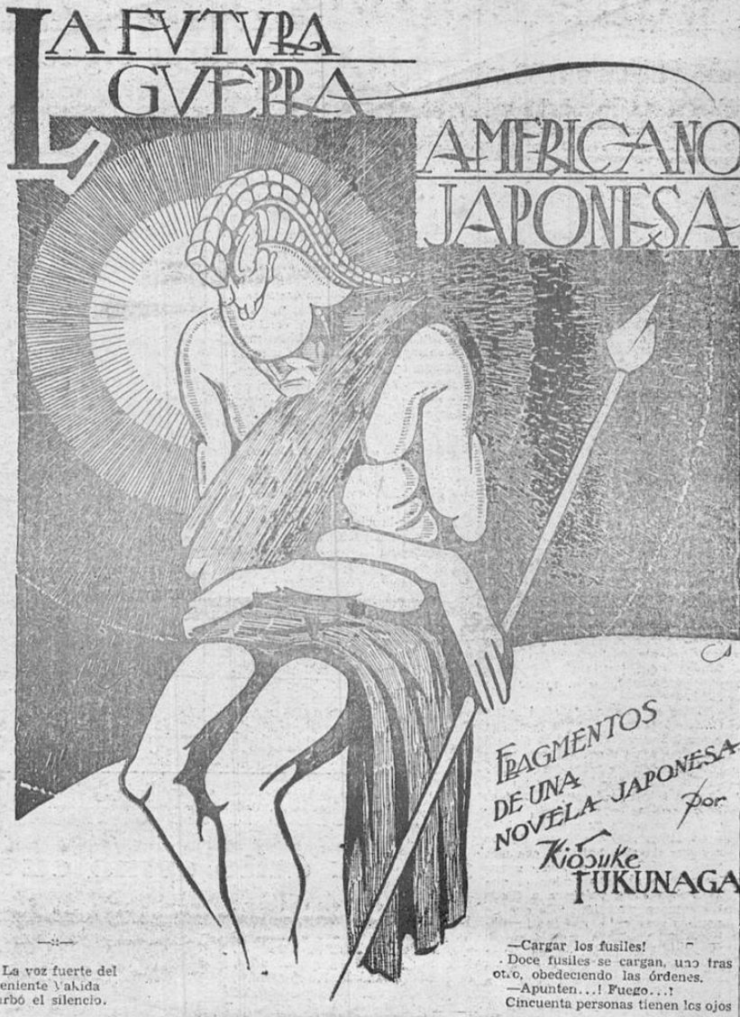
La voz fuerte del teniente Yakida turbó el silencio.

Como el código militar castiga con la pena capital el rompimiento de una acción militar de iniciativa personal, el teniente Maki es condenado a muerte. Esa muerte la pidió él mismo y afirmó que la historia le daría la razón.